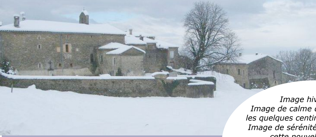
Image hivernale Image de calme du village sous les quelques centimètres de neige Image de sérénité attendue pour cette nouvelle année. Que 2017 vous soit meilleure !

Pendant ces jours de fêtes nous avons tenté d'oublier nos contraintes personnelles, les menaces nationales et internationales, les souvenirs douloureux et en ce début de janvier concentrons nous pour un beau début d'une nouvelle année.