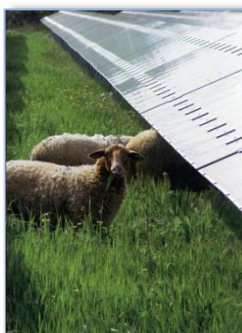
On y fait aussi paître des moutons

La modification anticipée des conditions de rachat d'EDF a interrompu le débat municipal jusqu'à la publication en mars prochain des nouveaux tarifs. Nous relancerons alors la concertation en étroite coordination avec le SDED (Syndicat Départemental d'Electrification de la Drôme).