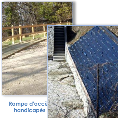
Rampe d'accès handicapés

Les fenêtres de la mairie laissaient passer eau et vent. Il était plus que temps de les remplacer. C'est chose faite, toutes les anciennes baies ont été remplacées par des fenêtres en PVC gris à double vitrage, haute isolation, pour un coût, après subvention, de 3568 € qui devrait être rapidement amorti grâce aux économies d'énergie engendrées.