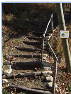
Chantier jeune 2011 Raccourci vers l'auberge